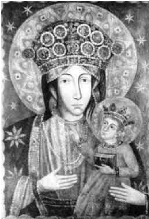
Obraz NMP Wspomożycielki Wiernych w Sanktuarium w Różanymstoku

Można powiedzieć, że nabożeństwo do Matki Bożej Wspomożycielki sięga początków chrześcijaństwa. Jak tylko zaczął rozwijać się kult wśród wiernych do Matki Zbawiciela, równocześnie ufność w Jej przemożną przyczynę u Boskiego Syna nakazywała do Niej się uciekać we wszystkich potrzebach życia. Tytuł przeto Wspomożycielki Wiernych zawiera w sobie wszystkie wezwania, w których Kościół wyrażał Najświętszej Maryi Pannie potrzeby i troski swoich dzieci.